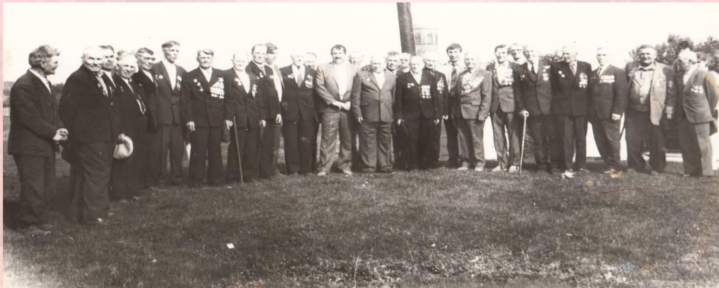
Митинг у Братской могилы с. Хвощеватовка 1972 г.

Но все эти события не мешали солдатам -фронтовикам каждый год 9 мая собираться у Братской могилы , чтоб поклониться своим фронтовым товарищам, которые погибли ради мирного чистого неба, ради радости и счастья . Приносили цветы на могилу похороненных здесь солдат и офицеров. Со слезами на глазах вспоминали те страшные дни .