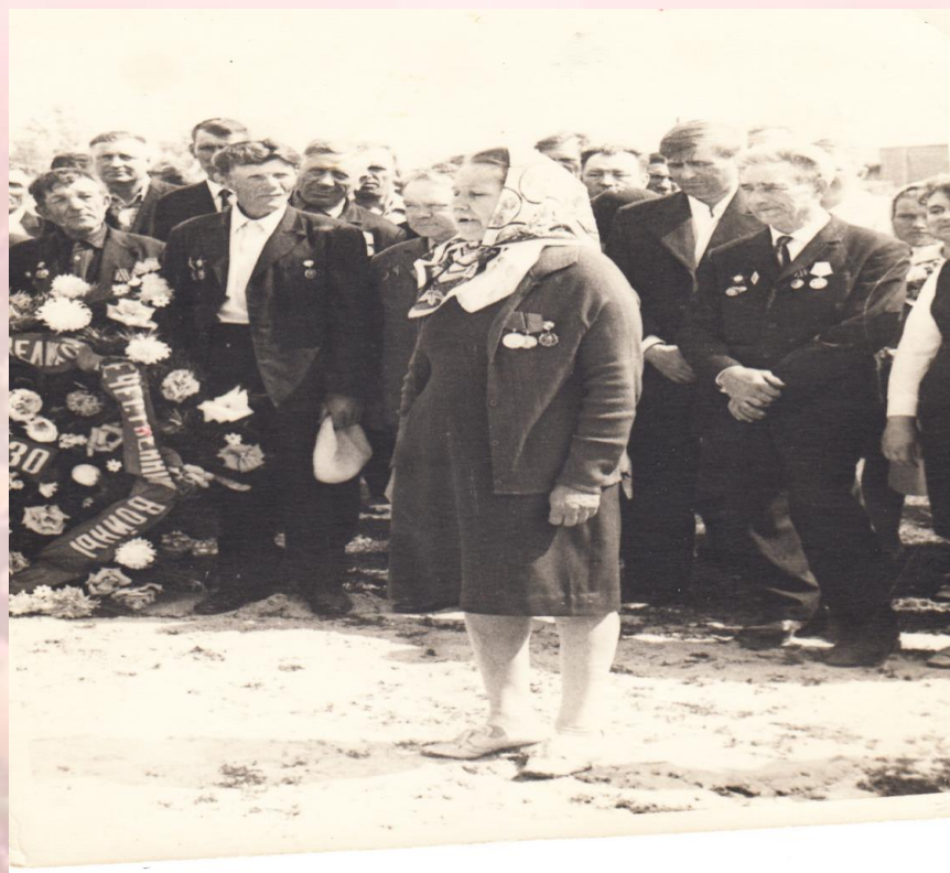
Митинг у Братской могилы 9 мая 1977 г.