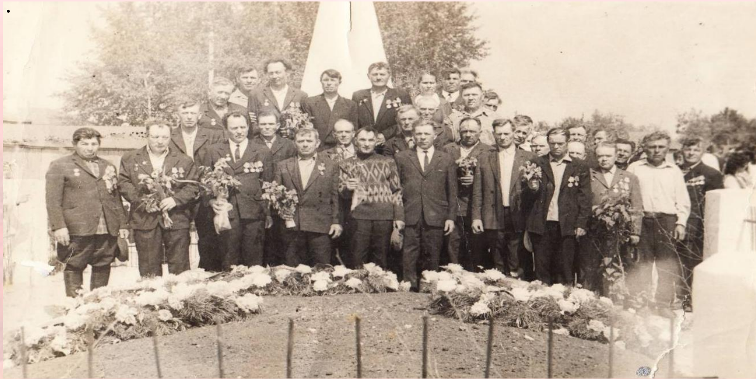
Ветераны Вов - жители с. Хвоцеватовка 9 мая 1976 г.

Перелистывая альбом, беру в руки другую фотографию . Поколение людей, победивших фашизм, постепенно уходит, оставляя нам великую память об их подвигах. Эти люди, как никто другой, умеют ценить жизнь, её простые радости. Я думаю, что они служат и будут служить примером для нас и последующих поколений.