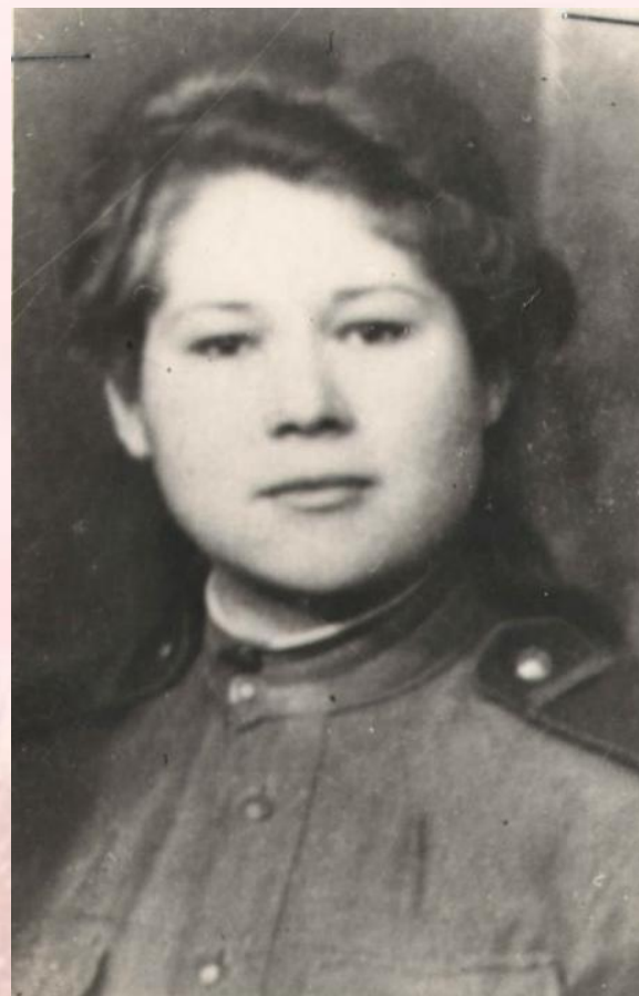
Фото военных лет