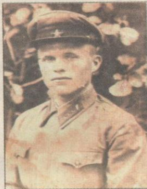
Мои прадедушка и прабабушка. Фото военных лет.

Смотрю на другую фотографию, она совсем старая. Подписано «1944 год». На ней огромный танк и много солдат в военной форме, какую я вижу по телевизору, когда показывают старые военные фильмы. Среди них в центре мой прадедушка, он защищал Сталинград и как хороший знаток техники ремонтировал танки. Однажды был такой случай. Под прямым миномётным огнём немцев прадед вытащил