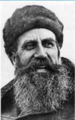
ОТТО ЮЛЬЕВИЧ ШМИДТ (1891 - 1956)