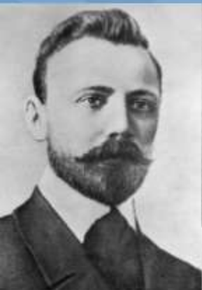
СЕДОВ ГЕОРГИЙ ЯКОВЛЕВИЧ (1877 – 1914)