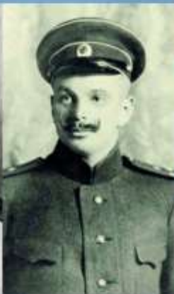
БРУСИЛОВ ГЕОРГИЙ ЛЬВОВИЧ (1884 – 1914)