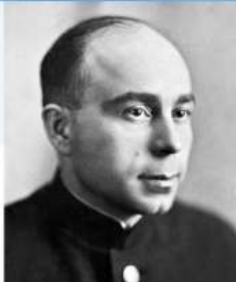
ГЕОРГИЙ АЛЕКСЕЕВИЧ УШАКОВ (1901 - 1963)