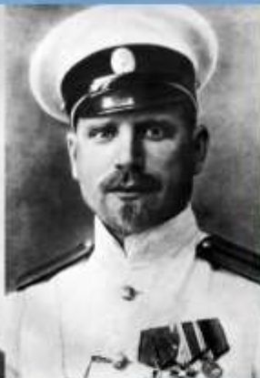
СЕДОВ ГЕОРГИЙ ЯКОВЛЕВИЧ (1877 – 1914)