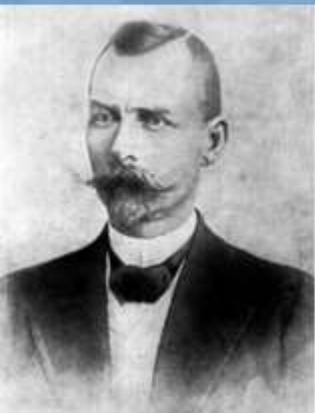
ЭДУАРД ВАСИЛЬЕВИЧ ТОЛЛЬ (1858 - 1902)