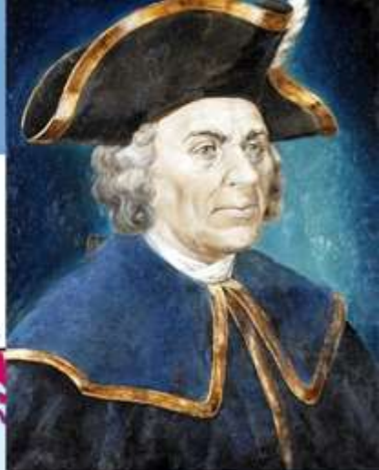
ВИТУС ИОНАССЕН БЕРИНГ (1681 – 1741)