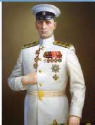
АЛЕКСАНДР ВАСИЛЬЕВИЧ КОЛЧАК (1874 - 1920)