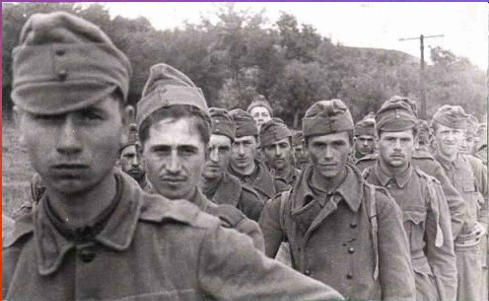
Пленные венгерские солдаты, 1943